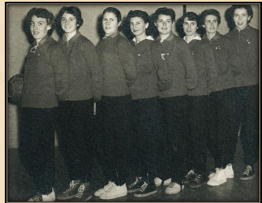
AAJ BLOIS : 9 participations au plus haut niveau avant 1960.

1956 : Foyer St François de Bourges contre CJF Fleury les Aubrais, un match au sommet de l'Excellence régionale.