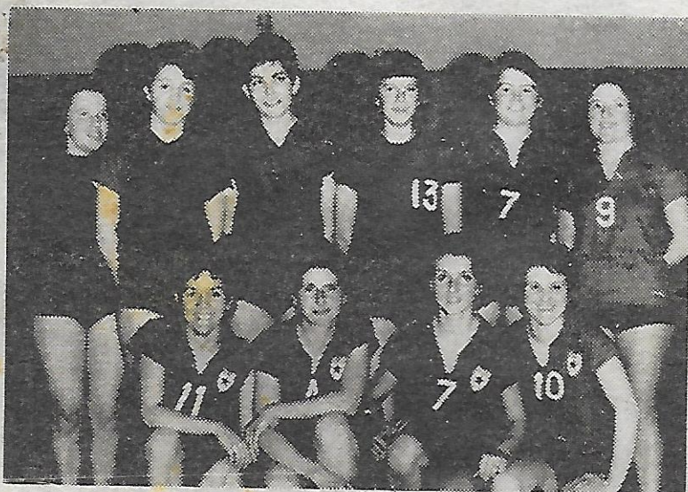
L'EQUIPE FEMININE ASSOISTE

BENJAMINS — N'ont pu être engagés en octobre: plusieurs éléments se sont sérieusement entraînés et tout laisse supposer