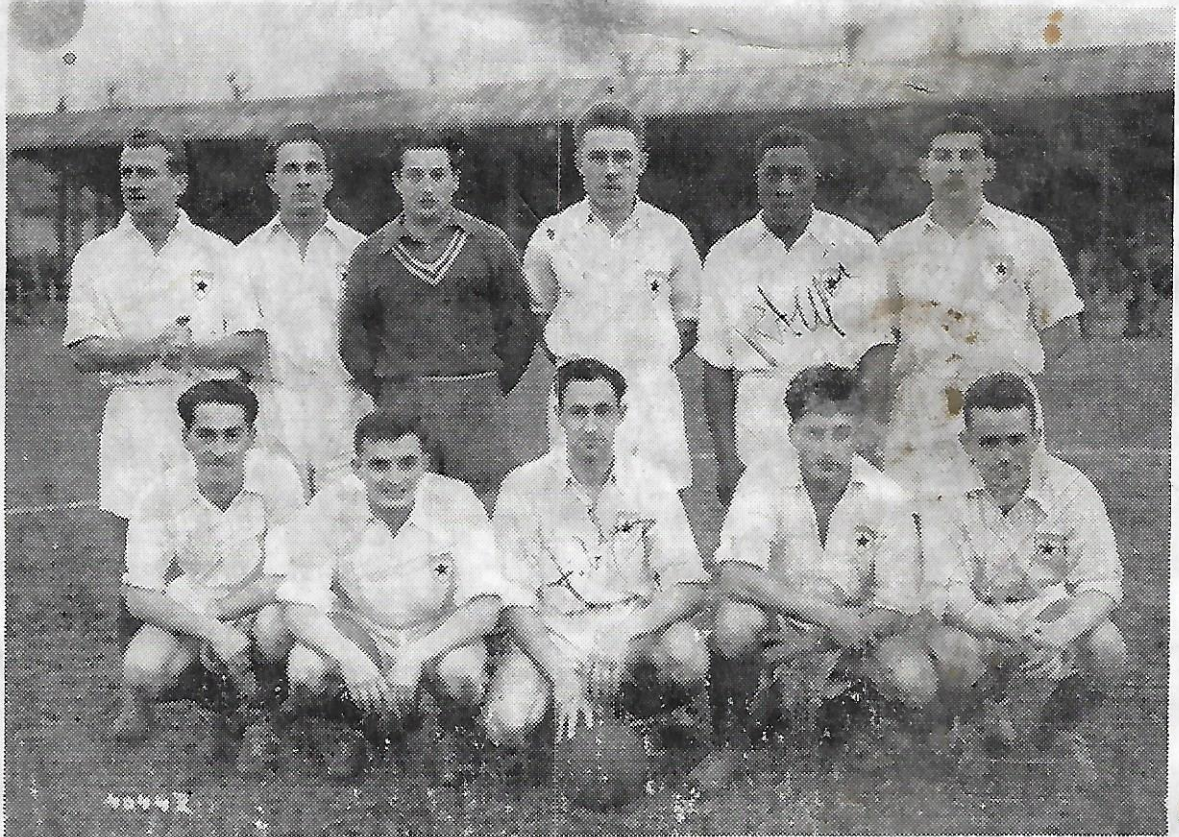
ARAGO 1 - 1949