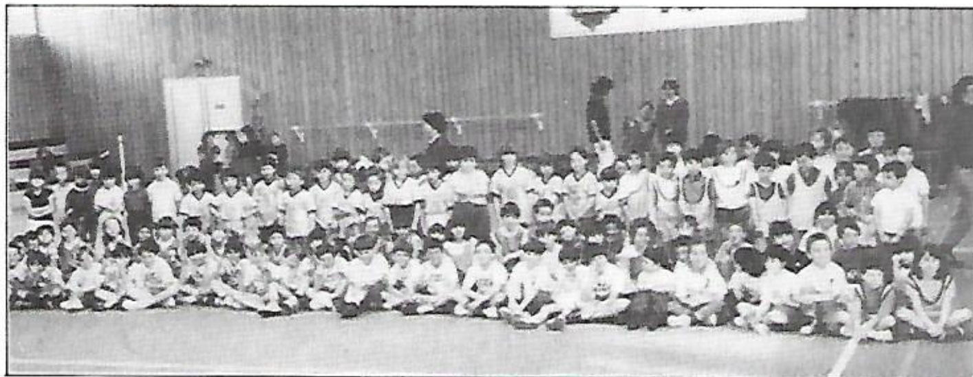
Baby-basket - 3 février 1990 - Châtillon-sur-Loire