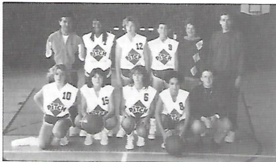
L'équipe Minimes Filles du C.J. FERRY LES AUBRAIS invaincue à ce jour en trophée MILO